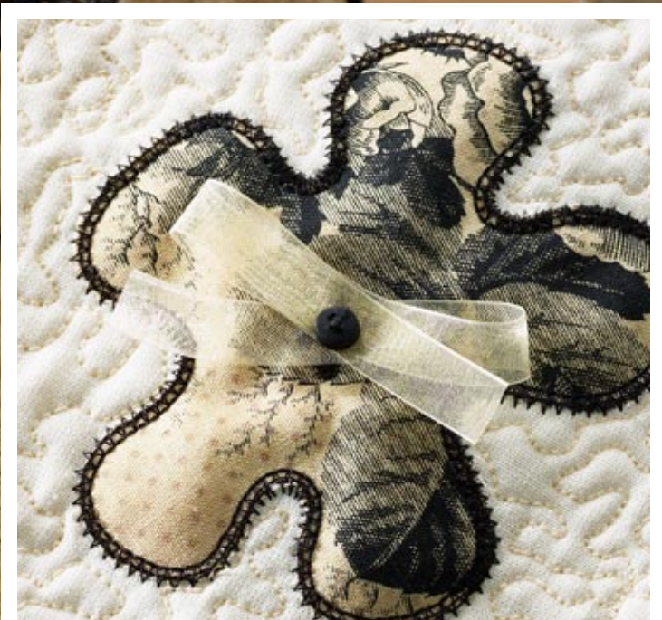
De stiliserade applikationerna med blommor och blad i olika svarta och vita mönstrade tyger har broderats och dekorerats i olika storlekar och med olika tekniker.